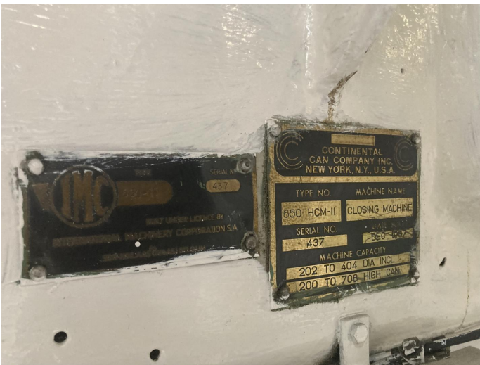
Continental Can 650 HCM-II sertisseuse CPN 5972 - Page 3 de 3